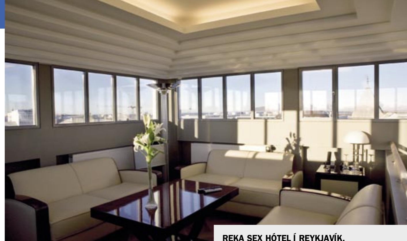
Setustofa turnsvítunnar er þar sem áður voru opnar svalir.

Lúxusgisting, fyrsta flokks þjónusta og góðar veitingar biða gesta á Hótel Borg nú sem í upphafi. Markmið stofnandans, Jóhannesar Jósefssonar, var að koma á Borgina væri sönn upplifun og það markmið er óbreytt.